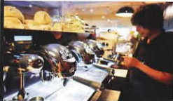
白色的 Victoria Arduiro 咖啡機，酷爆！

不過，對於愛啡一族，咖啡 counter 更醒神，兩部全白色光面的 Victoria Arduiro 咖啡機勁型，是咖啡機中的「勞斯萊斯」。店子追求認真及質素穩定，特別從土耳其訂來兩部大型炒豆機，更從世界各地搜購生豆在店內炒豆。客人可在舒適的店內目睹一杯咖啡由炒豆、研磨至沖泡的整個過程。店方現時的 house blend 主要以巴西、非洲、南美及印尼的豆混合，試過 cappuccino，咖啡夠承托力，creama 足又帶餘韻，誠意十足。據說店方將連鎖經營，寄望質素可以保持水準。