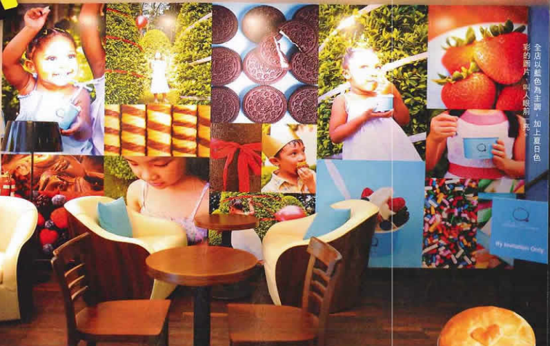
全店以藍色為主調，加上夏日色彩的照片，叫人眼前亮亮。